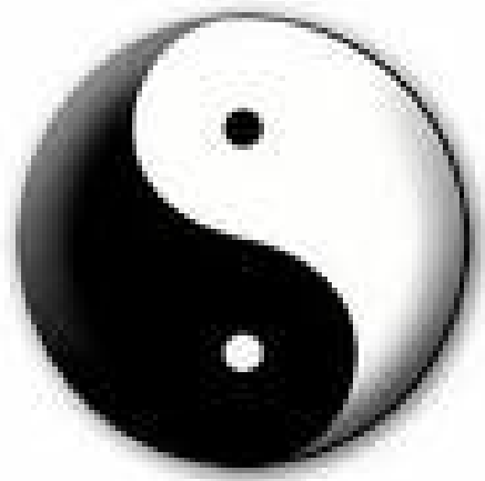
Yin en Yang teken, symbool voor het evenwicht tussen het vrouwelijke en mannelijke principe

Onze westerse maatschappij en economie is gericht op marktwerking, groei en actie, het mannelijke principe. Er is nauwelijks ruimte voor het vrouwelijke principe, rust, het ontvankelijke, innerlijke beschouwing, het intuïtieve en gevoel. De balans tussen actie en rust, inspanning en herstel, tussen geven en ontvangen, is niet tot nauwelijks aanwezig. Iedereen moet daar nu zelf actief balans in brengen, want de maatschappelijke structuur ondersteunt dit niet. En deze structuur gaat tussen 2008 en 2024 sterk veranderen, als Pluto door Steenbok loopt.